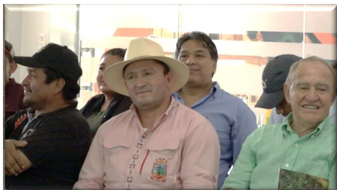
Alcalde de San Rafael y Pdte. Electo de la ACGAPCHCPAs – Sub Gobernador de Velasco