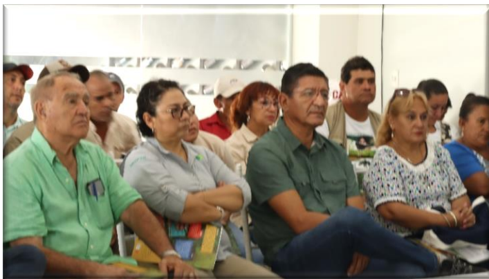
Autoridades participantes: Sub Gobernadores de Chiquitos y Velasco – Dir. Dicopan – Concejal San José