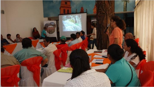
Participantes haciendo uso de la palabra en el 4 to Gran Taller.