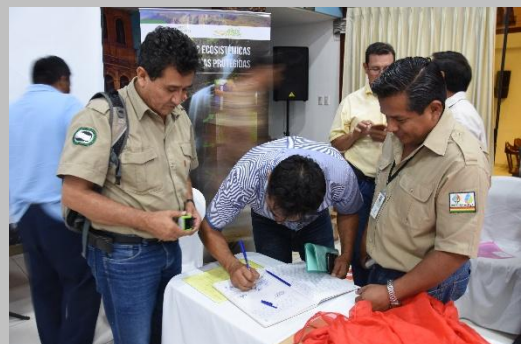
Participantes firmando el acta.