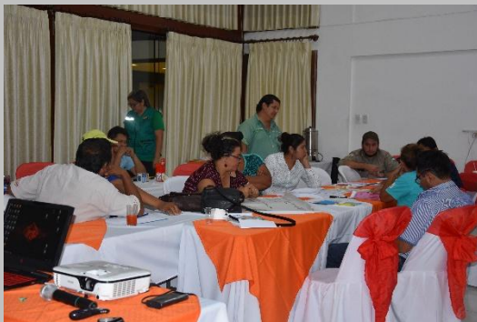
Mesa de trabajo del grupo 2.