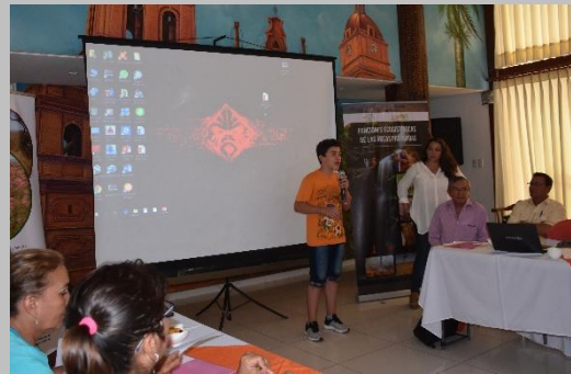
Multiplicador Ambiental de Roboré haciendo parte del encuentro.