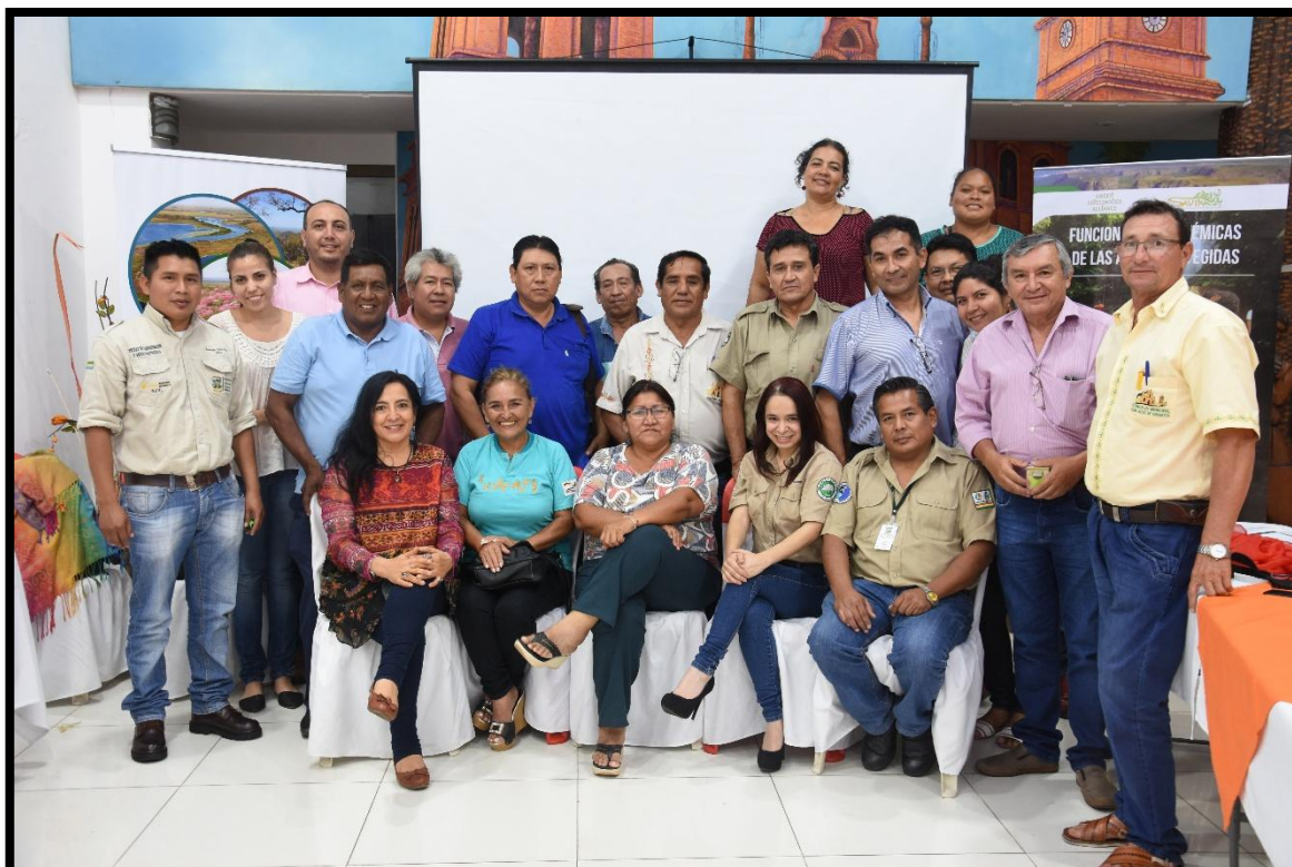
Participantes del 4 to Gran Taller de la Asociación de Comités de Gestión de las Áreas Protegidas del Chaco-Chiquitania Pantanal-Amazonía.