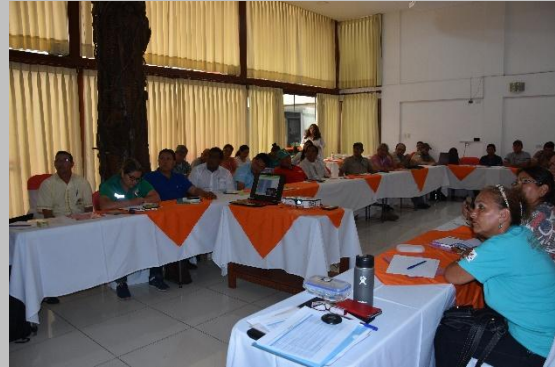
Participantes escuchando una de las presentaciones.